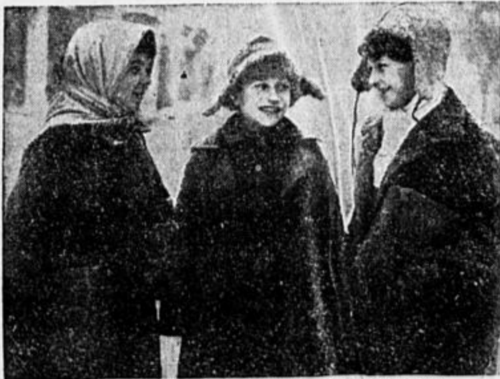
Ну и хорош, наш новый обществовед!

НАДО ТВЕРДО ПОМНИТЬ И НЕ ЗАБЫВАТЬ— НА ГАЗЕТУ ПОДПИСАТЬСЯ И РАСПРОСТРАНЯТЬ! ЧТОБ АКТИВНОСТЬ ПОДНЯЛАСЬ И НЕ УПАЛА — «БАРАБАН»—ПОДПИШИ — НЕ ЗАБУДЬ ЖУРНАЛА!